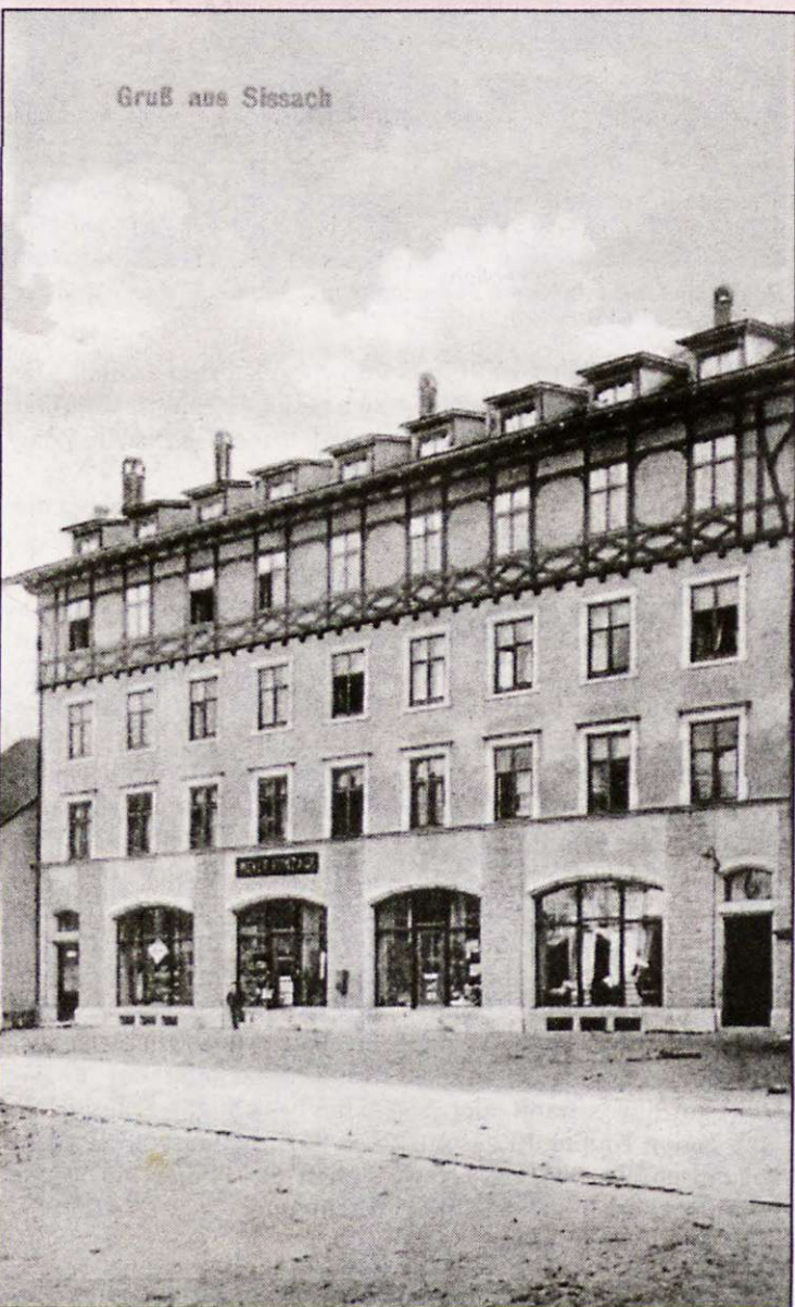
Postkarte des neuen Warenhauses aus dem Jahre 1903.